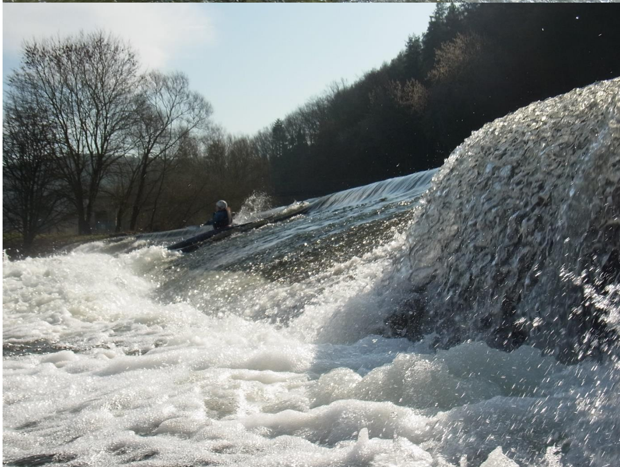
Bilder: Torsten Klakow, März 2024